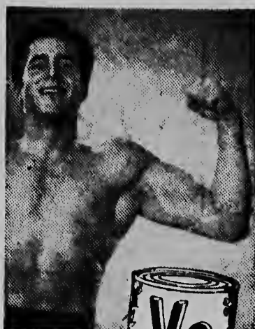
is een handelsmerk van de fabrikanten van Campbell's Soepen

Het sap van 8 verschillende soorten groenten tot vers uit de tuin is verwerkt in deze beroemde drank. U zult dol zijn op de levendige smaak en U uitstekend gevoelen bij deze weldaad aan vitaminen. Bij de maaltijd of tussentijds — V-8 geeft U de verfrissing die U wenst, en de voeding die U nodig heeft.